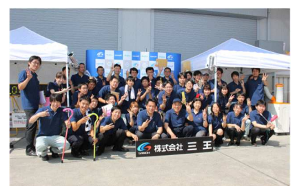
スタッフ全員集合

CONAFES2017 より新意匠性粉体塗料コナールトーンの全6シリーズが正式販売となりました。日本では初となる模様「スネークトーン」をはじめ6種類の意匠性粉体塗料がコナールに加わりました。こちらの方もどうぞお試しください。