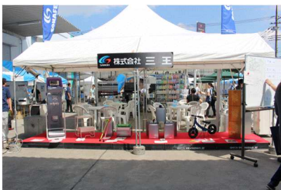
コナールで塗装された商品