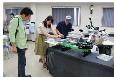
Tシャツシルク印刷体験

また、当社社員によるパフォーマンスとして「調色やろう」（溶剤調色解説）、「メンテのツボ」（塗装機器の分解組立実演）を実施しました。