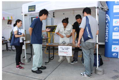
スプレーガン早組立てコンテスト