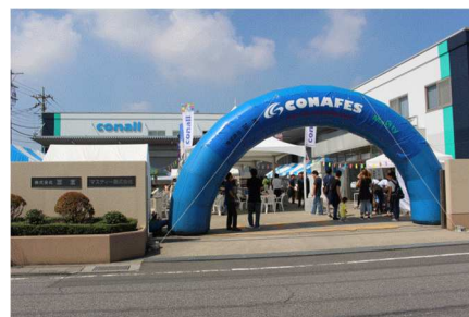
会場エントランス

2年前に開催した「CONAFES2015」は創業50周年感謝祭として工場見学や各種講演会も含め三王のすべてを見ていただきましたが今回の「CONAFES2017」は工業塗装業者様向けのイベントと位置付け、「塗装機械大集合」と称し国内外主要メーカーの工業用塗装機器を集め展示しました。