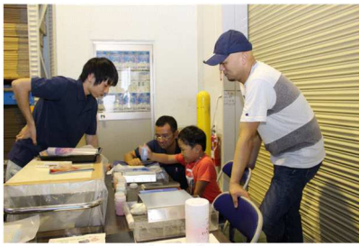
パウダーアート「こな絵」